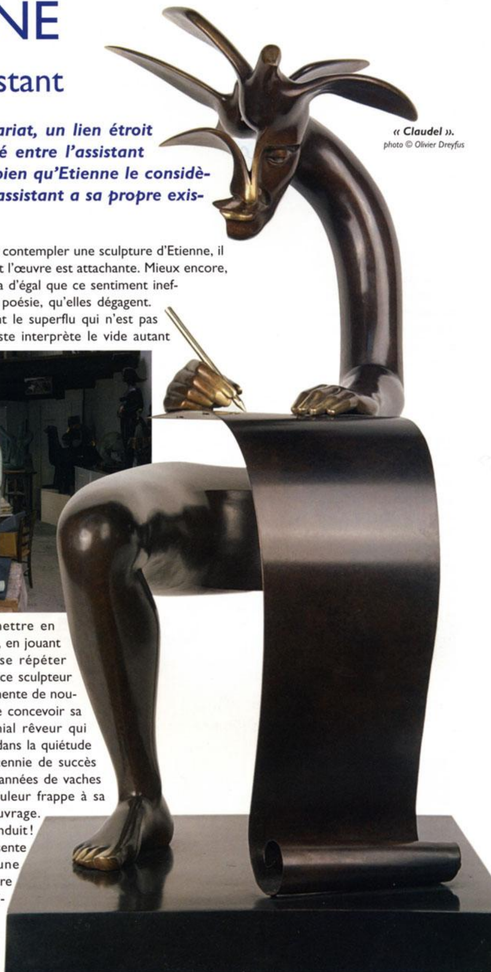
« Claudel ».