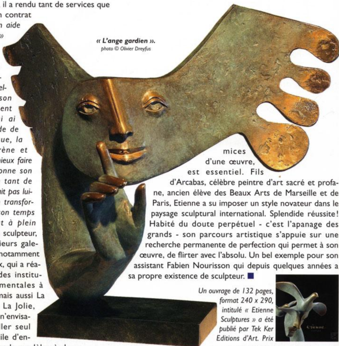
« L'ange gardien ».

« Il est toujours joyeux, il a de l'énergie, de la jeunesse, c'est un excellent mouleur et son salaire est largement rentabilisé. Je lui ai appris ma méthode de travail, la technique, la taille du polystyrène et maintenant il sait mieux faire que moi ! Il me donne son avis et m'apporte tant de choses que, s'il n'était pas lui-même sculpteur, je transformerais volontiers son temps partiel en contrat à plein temps ». Etienne le sculpteur, présent dans plusieurs galeries prestigieuses, notamment les galeries Bartoux, qui a réalisé des commandes institutionnelles monumentales à Rueil-Malmaison, mais aussi La Défense, Mantes La Jolie, Chalon sur Saône, n'envisage plus de travailler seul tant il est plus facile d'entreprendre les grands modèles à deux, mais aussi parce que le regard d'autrui, aux pré-